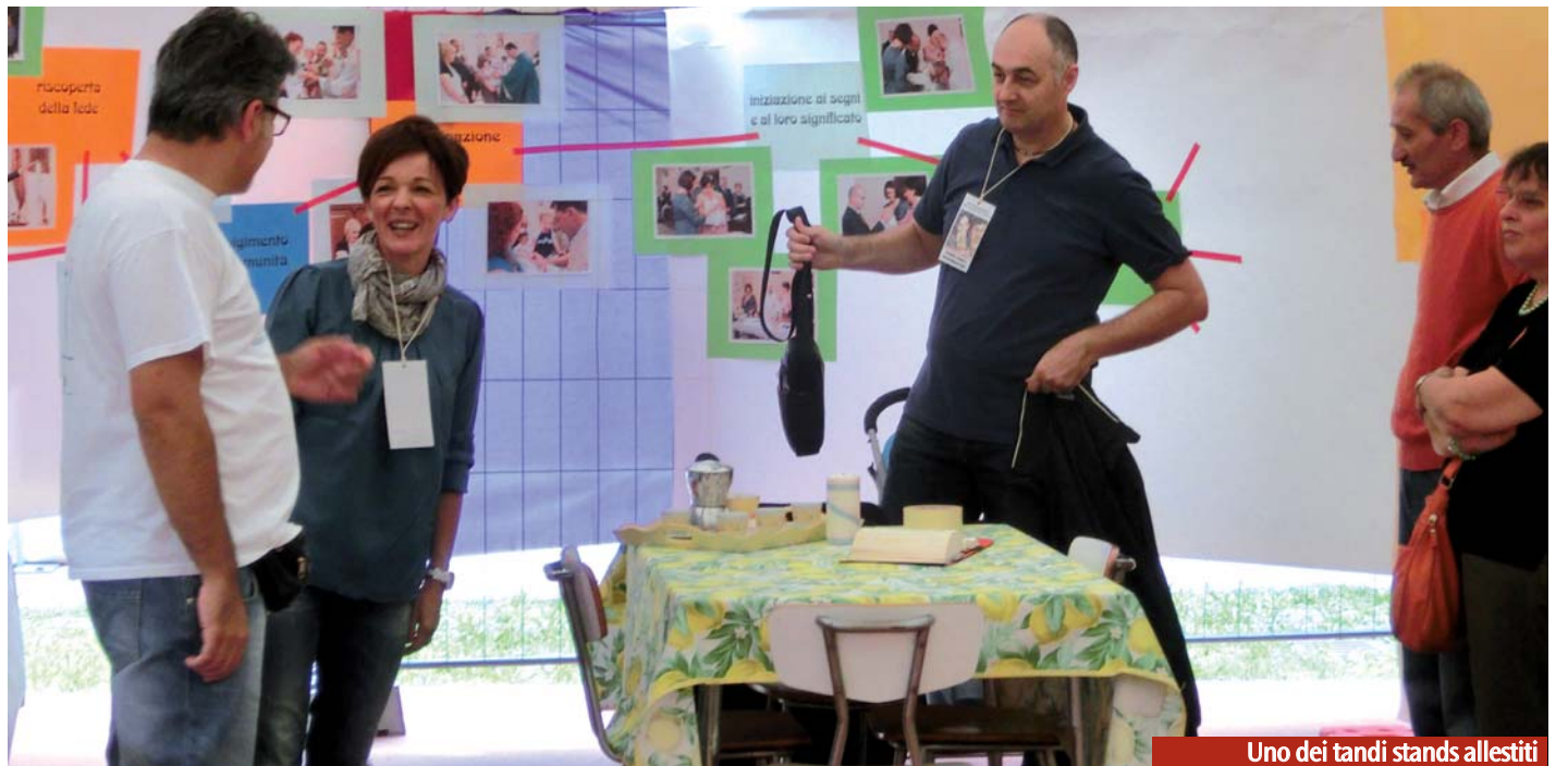
Uno dei tanti stands allestiti

tori si può godere della vista di una Chiesa in cammino, laici e sacerdoti insieme , che insieme condividono una parte, seppur piccola, di strada, che insieme cercano dove andare, che insieme entrano nei laboratori, che insieme si mettono in ascolto. I corridoi del Centro Pastorale si sono, così, gioiosamente trasformati e colmati di persone che curiose entrano nelle stanze e partecipano attivamente ai laboratori, interagendo con i relatori, facendo domande per meglio comprendere come poter, ognuno nel proprio piccolo, essere più Chiesa, come poter, nelle nostre parrocchie, riuscire a condividere per diventare sempre di più comunità. Ma ecco che lo scenario cambia e cambia anche l'immagine di Chiesa. Da Chiesa in cammino a Chiesa popolo di Dio , riunita in assemblea, in quell'assemblea qualificata dal fatto di essere stata convocata da Dio. E' Dio che ha radunato il suo popolo, affinché ascolti le Sue parole. Eccoci allora al momento della veglia di preghiera, riuniti ancora una volta insieme al nostro Vescovo e ai nostri sacerdoti ad ascoltare la Parola. Una Parola condivisa anche con i rappresentanti delle Chiese e Comunità ortodosse e protestanti presenti in diocesi.